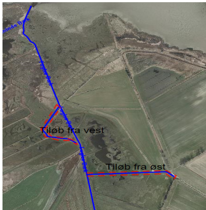
Fuglsø Bæk, Tilløb fra vest og øst nedklassificeres

På kortet nedenfor fremgår strækningen af ”Fuglsø Bæk, tilløb fra vest og øst” der nedklassificeres. (Markeret med rødt)